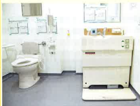
オストメイトトイレ設置例

さまざまな病気や障害などが原因で、腹壁に造られた便や尿の排泄口のことを『人工肛門・人工膀胱』といい、人工肛門・人工膀胱の総称が『ストーマ』です。ストーマを持っているかたのことを『オストメイト』と呼びます。